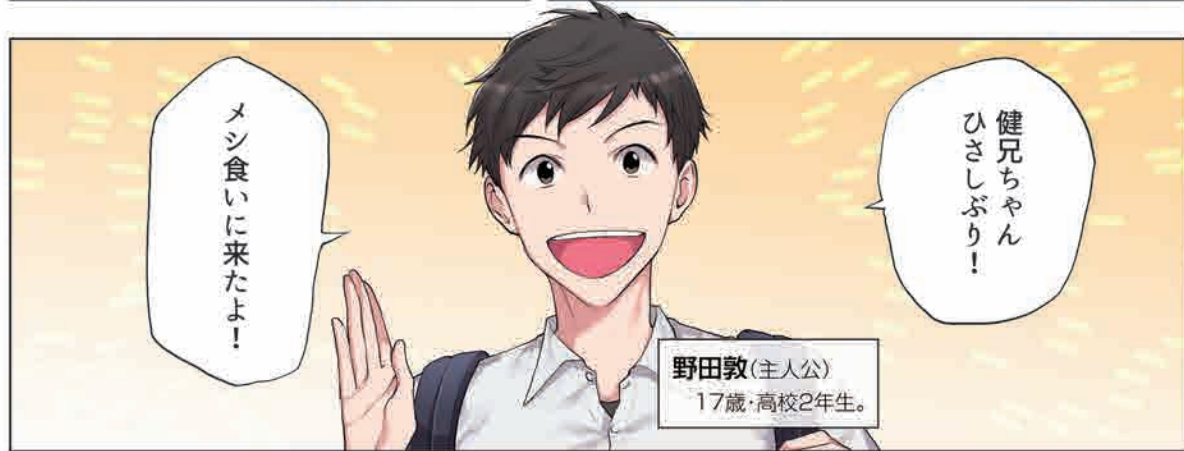
野田敦(主人公) 17歳・高校2年生。